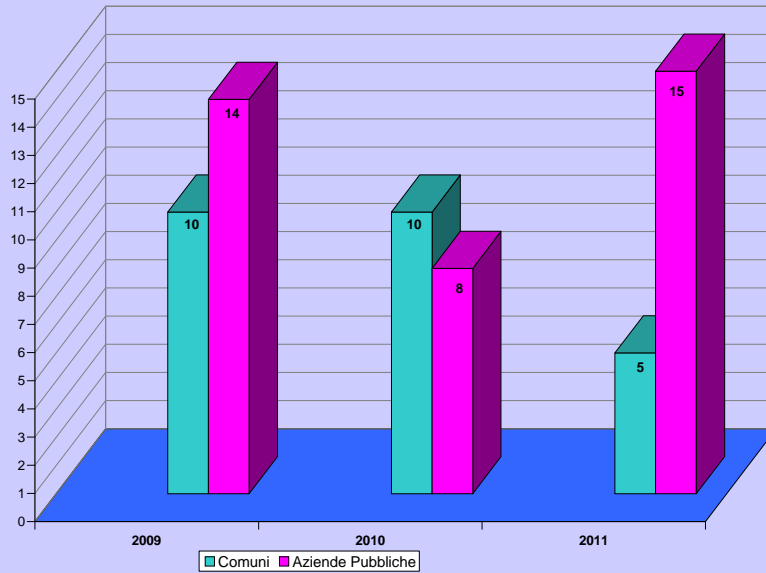
Bandi pubblicati nei mesi di Ottobre dell'ultimo triennio